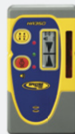
Приемник HR350, входящий в строительный комплект