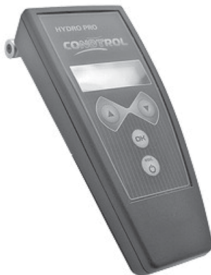
Рисунок 1 Общий вид измерителей влажности серии CONDRTOL (исполнение HYDRO PRO CONDRTOL)

1.3.1 Конструктивно влагомеры состоят из электронного блока и преобразователя (рис. 1).